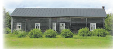
Paltaniemen perinnepäivät Immolan savupirtti on Paltaniemen vanhimpia taloja. Sen ja Rusalan pihapiirissä vietetään Paltaniemen perinnepäiviä tapahtuman aikana.