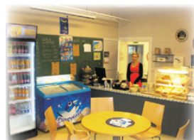
Café Paltaniemi Paltaniemi palvelee Paltaniemi -päivien aikaan Kahvilasta saa myös ruokaa.