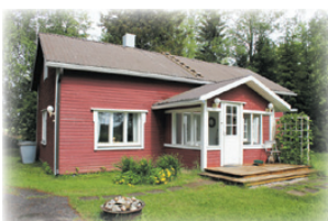
Vähälän torppa Paltaniemellä oli 1800 -luvulla torppia ja pieniä mökkejä, joita myöhemmin laajennettiin. Kun vehnäpulla tuli Paltaniemelle, ruvettiin pitämään pirttikahviloita. Vähälän torpassa on päivien aikaan tutustumismahdollisuus sekä myynnissä käsityötuotteita, kirpputori ja pirttikahvila. Pappilanniementie 198.